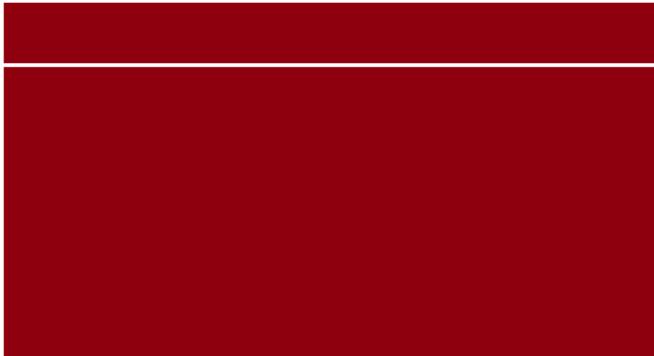
pushdown 970x90 > 970x415